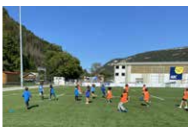
Semaine rugby Septembre 2023 Classes du CP au CM2