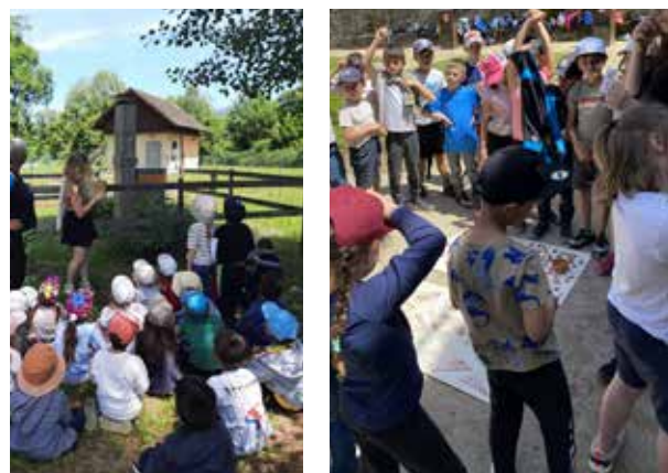
Sortie de fin d'année Chanaz Mai 2024 Classes de maternelle, CP, CE1 et CE2