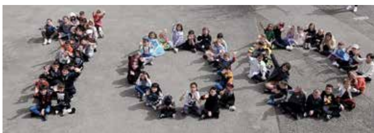
Le 100ème jour d'école - Avril 2024.