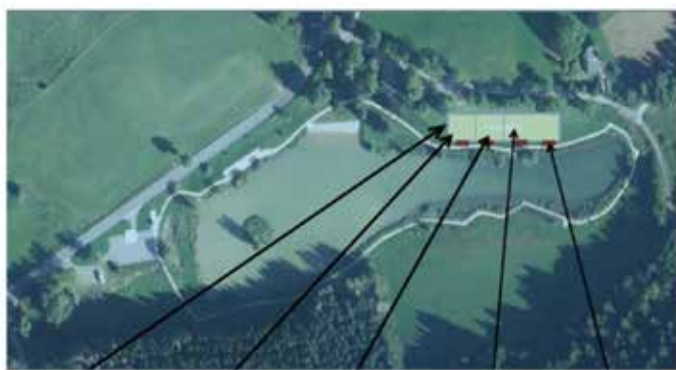
Fleur sur le tour du terrain 8 terrains de pétanque 24m x 13m 3 terrains jeu provençal 24m x 13m Aire de jeux 48m x 13m bancs

Suite à la création de l'association « Le Cochonnet Montagnard » sur la commune, le conseil municipal a approuvé lors de ses séances du 22 janvier et du 8 avril derniers, la réalisation d'un ensemble en stabilisé comprenant deux espaces distincts : avec 8 pistes de jeu de pétanque et 3 pistes de jeu provençal, d'une part, et des terrains complémentaires qui permettront des compétitions de pétanque à l'échelle départementale quelques jours par an et des activités ludiques durant le reste de l'année, à la disposition de tous les visiteurs.