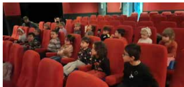
Cinéma - Classe de maternelle