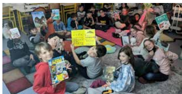
Nuit de la lecture Janvier 2024 - Classes CE2 au CM2