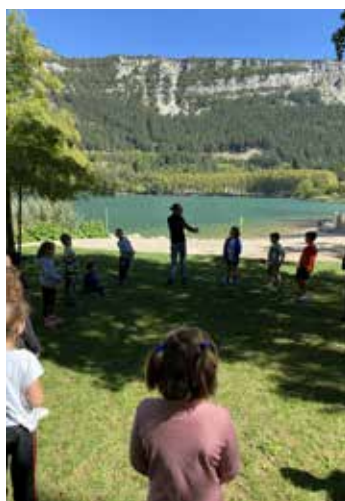
Sortie nature au lac de Nantua Sept 2023 - Classes CP et CE1