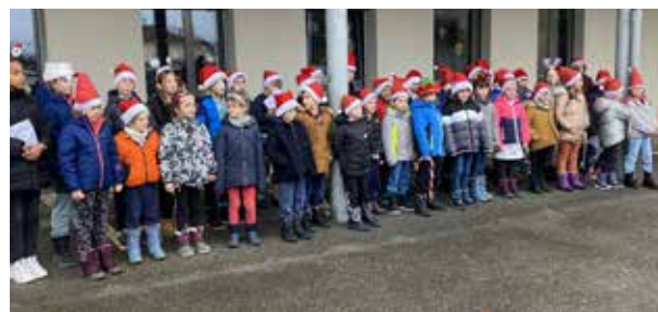
Chorale Noel Décembre 2023 - Classes CP au CM2.