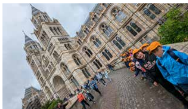
Voyage à Londres Mai 2024 - Classes CM1 et CM2