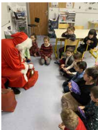
Passage du Père Noël Dec 2023