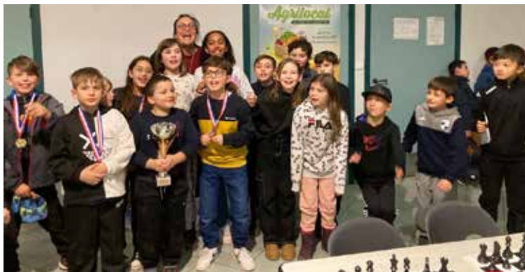
Championnat départemental et académique d'échecs scolaire Mars 2024 CE2 - CM2. La classe de CM2 est championne de l'Ain et a participé à la finale académique.