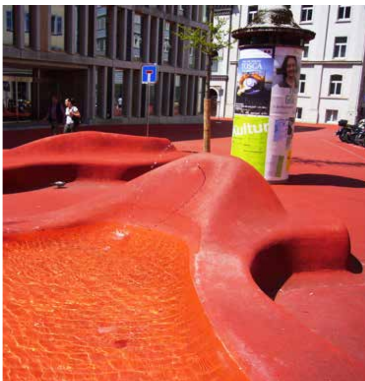
Sankt Gallen en Suisse orientale