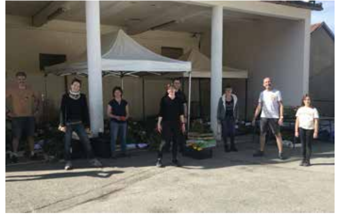
Vente de plants

enfin en juin, la dernière manifestation de l'année, la vente de Galettes, n'a été rendue possible uniquement grâce à la présence des parents bénévoles venus nous prêter main forte et à une équipe toujours aussi efficace au four !