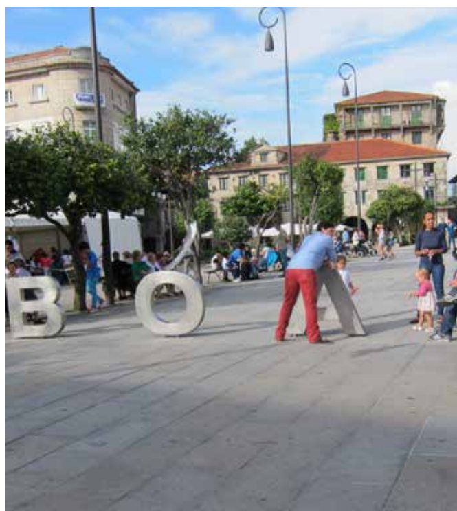
Pontevedra, dans la Communauté autonome de Galice, en Espagne du Nord-Ouest