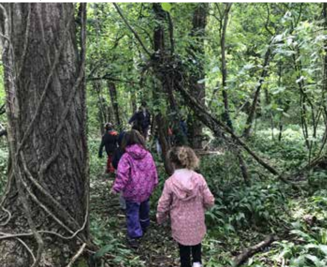
Sortie auparc de Miribel

Au mois de mai, avec le déconfinement progressif, nous sommes heureux d'avoir pu maintenir la vente de plants ! C'est avec un immense plaisir que nous vous avons retrouvé, en présentiel, pour cette vente très agréable de plants maraîchers et paysagers qui a réussi à échapper aux orages pourtant nombreux. Et