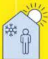
RESTEZ AU FRAIS