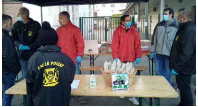
Vente de saucisson du mois d'octobre

Nous avons également planté quelques vivaces devant l'Eglise et la Mairie du Poizat,