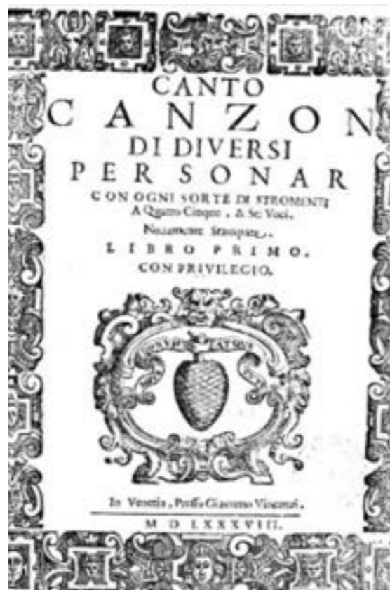
Canzon di diversi per sonar con ogni sorte di stromenti a quatro cinque, & sei voci, Venise, Giacomo Vincenzi, 1588

Les plus grands succès de la musique vocale lors de la Renaissance ne nous sont connus que de manière indirecte, par le témoignage écrit de leurs versions instrumentales. Une semaine durant, musiciens professionnels et amateurs de haut niveau de l'ensemble Les bois sonnants se sont consacrés à l'interprétation de ces sources, en appliquant les principes de la solmisation et de la diminution collectives tels qu'ils étaient pratiqués par les interprètes de la fin du seizième siècle. Flûtes et voix feront résonner, sous la voûte de l'église du Poizat, les madrigaux d'un Palestrina ou d'un Cipriano de